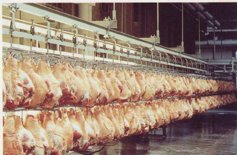
Cosce di suino mondate pronte per la trasformazione.